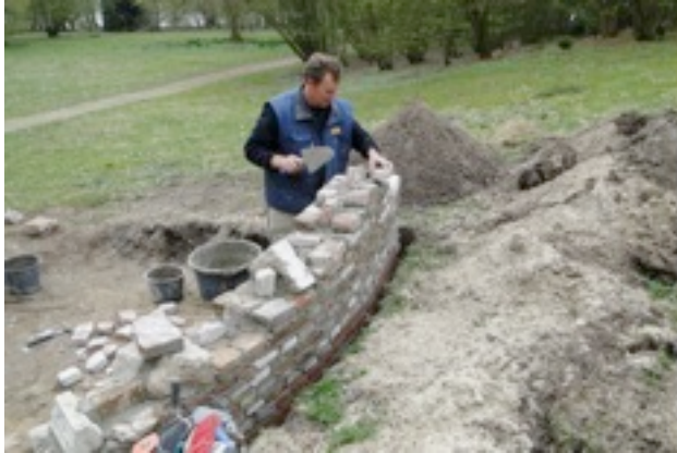
De laatste steen

m/v en macht, alles aangeaard en ingewaterd. Overtollig zand gaat gebruikt worden om het bospad dat, door jaren harken, is uitgediept op te vullen. Passant melde een wolzwever. Witjes en blauwtjes in de lucht naast hommels, zweefvliegen en wespen. Muur, ereprijs, bosaardbei en nog veel meer moois in bloei. In de vijver kikkervisjes en fonteinkruid. Op het water springstaarten en een schaatsenrijder. Nijlganzen waren even op de kant.