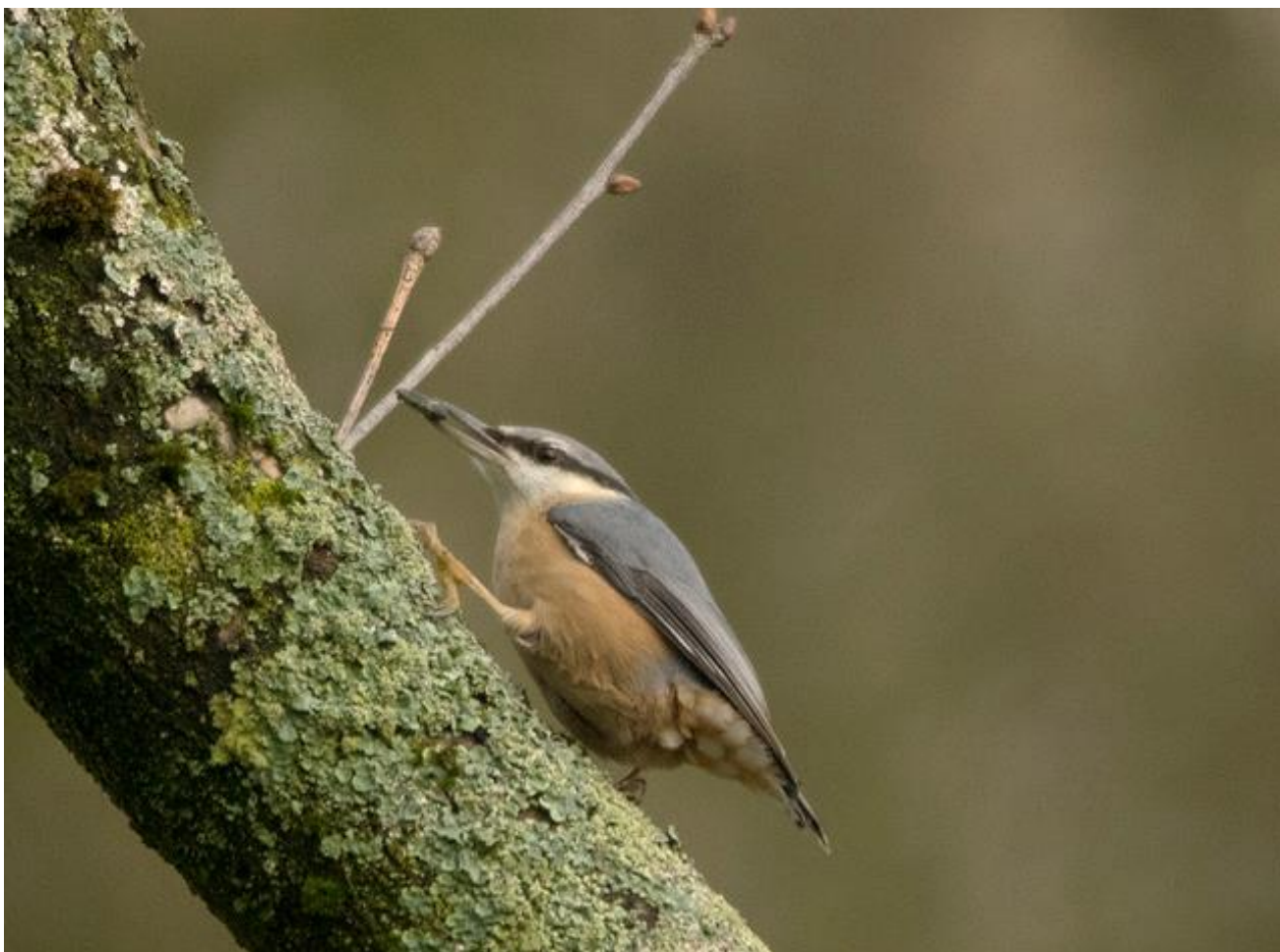
FOTO VAN DE MAAND Tineke van Wegberg. Meer van haar werk is te zien op: https://www.facebook.com/denbosch.zuid