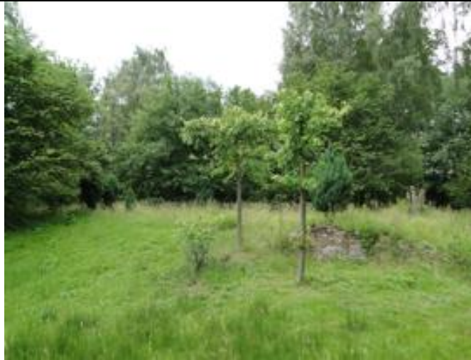
Bomen bij muur herstellen zich