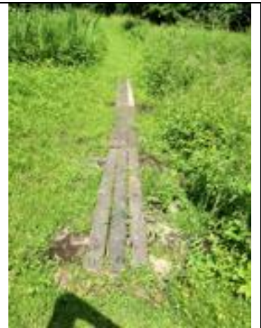
Brug is af