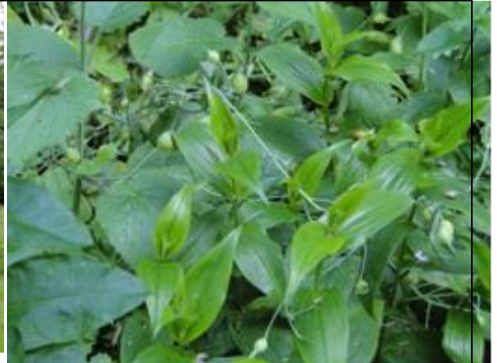
Weten we nog niet.