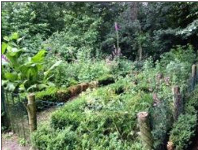
Kruidentuin staat er mooi bij

19-21 juni Totaal 4 keer gecontroleerd op ongewenst bezoek. Geen jeugd en geen rommel.