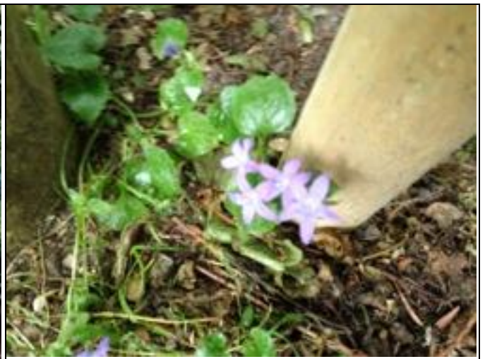
niet gedetermineerd klokje bij bord.

20 juni Een heel grote ploeg gemeentelijke raapstokkers heeft vanaf strandbad tot brug achter lyceum geraapt. Ze zijn niet in het park geweest.