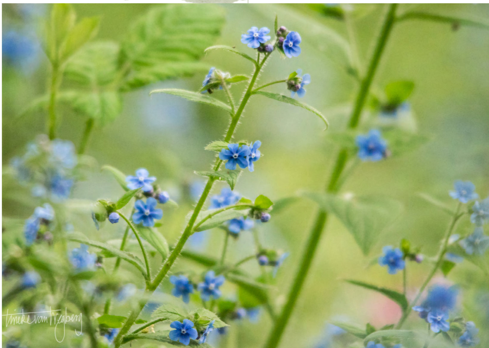
DE PRACHTIGE OSSETONG BLOEIDE MAAR KORT DOOR DE DROOGTE

Omdat er vanaf 1 JUNI WEER MET GROEPEN VAN MAXIMAAL 30 PERSONEN buiten samengekomen mag worden hebben ze besloten dat er op woensdag 3 juni weer als groep gewerkt mag worden maar natuurlijk