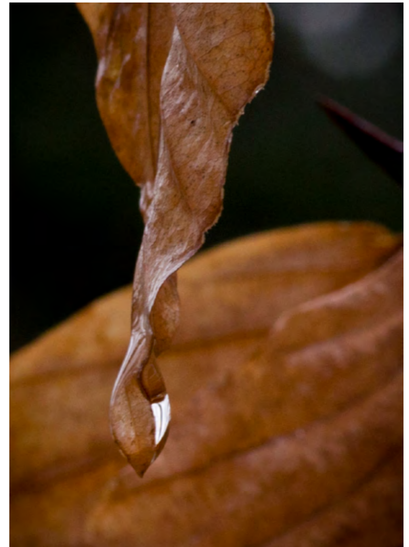
NATTE DAGEN WAREN ER OOK GENOEG

Iemand schept er blijkbaar genoeg in om de boel te saboteren. We zijn ons aan het beraden op maatregelen. Mocht er iemand